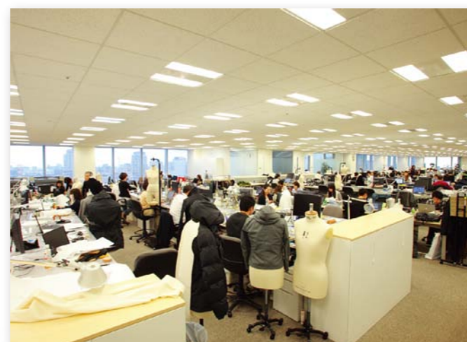
商品系部署の執務室と商品検討スペース。企画開発の検討後、パタンナーが見本を制作するエリア。そのためライブラリーやサンプル庫も設置されている。 29階の関係性の高い部署とは内階段で結ばれており、検討会議もスムーズに行なっている。