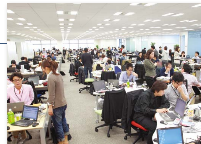
活気あふれるオフィス風景。 フットワークがよく、他の人の席に行ってその場で打ち合わせを始める社員が多いのが特徴的だ。