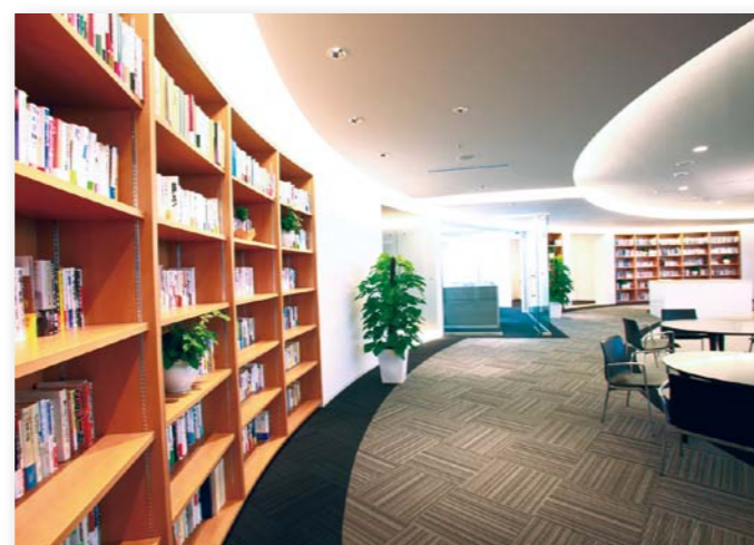
経営者を育成するための研修サロン。内外の講師とのディスカッションが常に行え、 企業理念の浸透や拡散に繋がるような仕掛けづくりをしている。