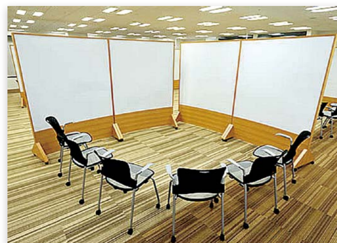
FRMIC (ファーストリテイリング・マネジメント・イノベーションセンター)と呼ばれる研修施設。 写真はセミナールーム。