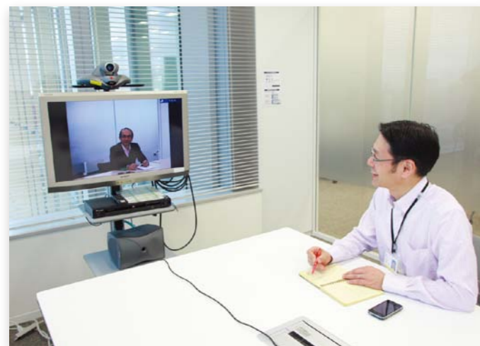
今回の移転で50セット以上を導入したテレビ会議システム。 現在、積極的な海外進出を行っており、海外とのやり取りに効果的に活用している。