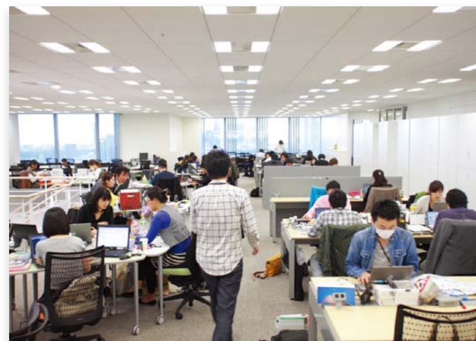
通路スペースをしっかりと確保した29階のオフィス。 縦横斜めどこにでも移動しやすいレイアウトになっている。