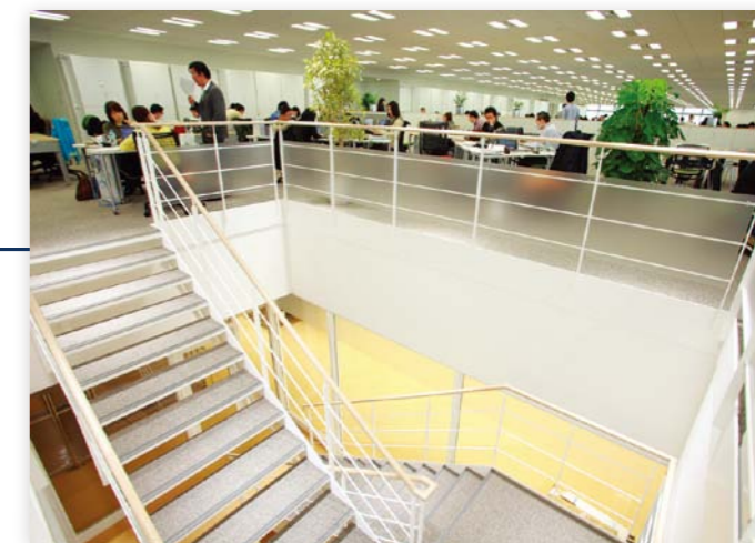
29階の商品系の部署と28階の商品検討スペースやライブラリーとを結ぶ内階段。 移動がスムーズに行えるため利便性が高い。