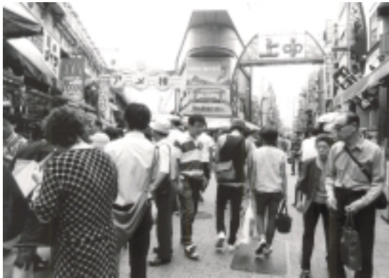
平成13年9月5日

上と下の写真を見比べると右上に写っている「上野中通り」の名称が「上中(読み方は「うえちゅん」)」に変わっていることに気がつくだろう。このデザインにダンボールなどの素材を使った立体作品で有名な日比野克彦氏を起用したことから、「アメ横」に対するイメージを変えようとする商店街の意気込みが感じられる。さらに昨年11月には、アメ横商店街連合会に所属する約43店舗がホームページを開設( http://www.ameyoko.net/ )。今はまだPR的な内容が多いが、今後は積極的に商品の販売を行なっていくという。このように「アメ横」は新しいものを取り入れながら伝統を守っていくようだ。