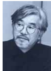
内田 繁氏 デザイナー

1943年、横浜生まれ。桑沢デザイン研究所卒業。81年、スタジオ80設立。代表作にYOHJI YAMAMOTOの店舗、京都ホテル・ロビー、神戸ファッション美術館、門司港ホテルなどがある。毎日デザイン賞、第1回桑沢賞ほか多数受賞。著書に『インテリアと日本人』『椅子の時代』『日本のインテリア』などがある。