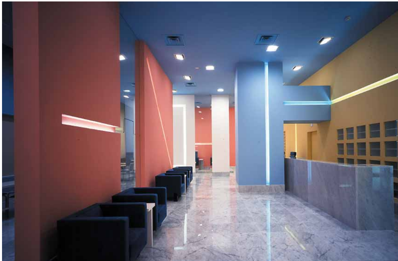
Longleage(ネイルサロン) Nicasa&Partners Inc.

1943年、横浜生まれ。桑沢デザイン研究所卒業。81年、スタジオ80設立。代表作にYOHJI YAMAMOTOの店舗、京都ホテル・ロビー、神戸ファッション美術館、門司港ホテルなどがある。毎日デザイン賞、第1回桑沢賞ほか多数受賞。著書に『インテリアと日本人』『椅子の時代』『日本のインテリア』などがある。