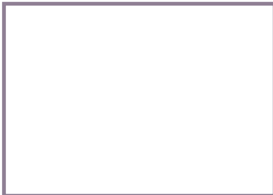
ブース内は、パソコンの他にMOドライブやスキャナなどの周辺機器が接続されている。その場でドキュメントを作成することもできるし、タイムシェアでブースだけのレンタルも可能だ

さらにキンコーズ・ジャパンでは、国土が狭く地価が高い日本ならではの利用方法も提案している。 もしも100mか200mの距離にキンコーズの店舗があれば、その範囲内にあるオフィスはコピー機や製本機などを個々に備えなくてもいい。それらの作業は全て、キンコーズで行えばいいわけだ。そうすれば個々のオフィスは、その分の機器代や設置、作業スペースなどを節約できる。 自分の会社がペーパーレス化を実現していても、客先での営業活動などには紙の書類を必要とする場合が多い。だが、最近では「モバイルオフィス」として使える場所が街中が増えてきた。これらを活用することで今後、モバイルワークの可能性はますます広がっていくだろう。