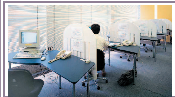
箱崎オフィスへ訪れてきた社員が使用するために設けられたドロップインオフィス

しかしフレキシブルオフィスだけでは、根本的な業務の改善にはつながらない。より仕事の効率や社員の満足度を上げるために箱崎オフィスでは、95年から97年にかけてモバイルオフィスの導入が推進されてきた。 席の配置に関するかぎり、モバイルオフィスとフレキシブルオフィスは何も変わらない。この両者に違いをもたらしているのは、パソコンや電話などの情報機器とグループウェア(情報を共有・活用するためのツール)などによる情報技術だ。 まずは営業系社員に薄くて軽いノート型パソコンを貸与。電話機も、それぞれの社員に構内型のPDAを配布した。それと並行して、電子メールやグループウェアの活用によるペーパーレス化を推進。営業職が作成する約240種類の伝票に関しては、これまでに全てペーパーレス化を完了している。社外から送られてきたFAXもグループウェアに取り込み、どこでも見ることができる体制を整えた。これらの機器を活用すれば社員は、どこにいても仕事をする事ができる。自分の席にこだわる必要は何もない。自宅や客先、サテライトオフィスなどからパソコンを社内のネットワークに接続しさえすれば、社内にいるのと全く同じように仕事ができるのだ。 また、箱崎オフィスには、ドロップインオフィスが用意されている。他のオフィスから箱崎オフィスへ訪れてきた社員が、パソコンを1グループウェアを活用して、どこでも書類を見ることができる環境を整えている